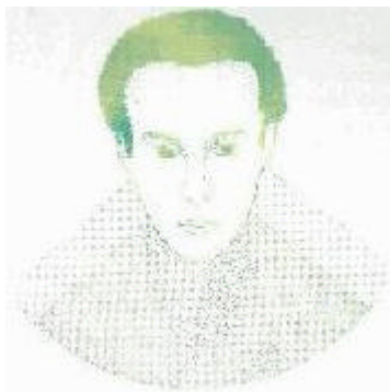
campo visivo dell'uomo

A distanza ravvicinata il cane nota anche il più impercettibile movimento che sfugge all'occhio umano e si credeva che i cani non vedessero i colori, mentre studi recenti hanno dimostrato il contrario: essi sono in grado di distinguere il rosso, il giallo, il blu e il verde. La diversa collocazione degli occhi rispetto all'uomo, meno frontali e più laterali, permette all'animale di avere un campo visivo di un'ampiezza maggiore e varia di razza in razza, per esempio nei cani da caccia gli occhi sono posizionati di lato, così da avere un campo visivo ancora più ampio, mentre nel boxer sono in una posizione centrale, il che gli permette di vedere bene da entrambi gli occhi, ma rende limitata la visione nei luoghi piccoli.